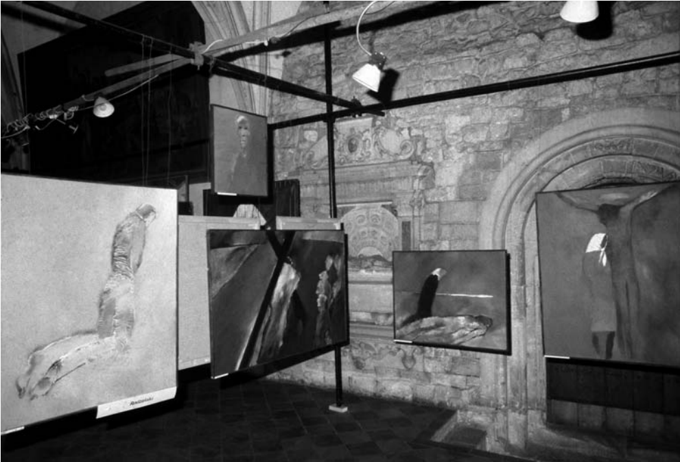
Wystawa „W stronę osoby”, klasztor oo. Dominikanów, Kraków 1985 r.

którzy przychodzili na te wystawy (była to duża wystawa w galerii miejskiej, jak i wystawy indywidualne w kościołach), patrzyli na pokazane tam prace jak na dzieła sztuki, a oni przecież nie bardzo wiedzieli, co to był ten stan wojenny. Okazuje się, że to były w większości bardzo dobre wystawy. Miały swoją siłę i były atrakcyjne, w najlepszym tego słowa znaczeniu.