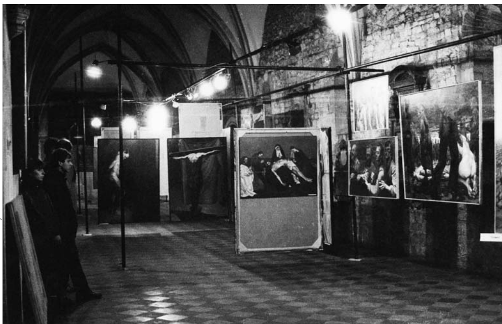
Wystawa „W stronę osoby”, klasztor oo. Dominikanów, Kraków 1985 r.