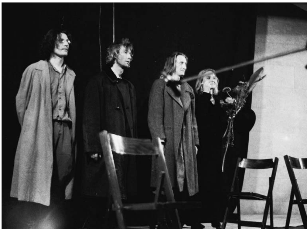
Występ Teatru Ósmego Dnia, Kraków-Mistrzejowice 1985 r.