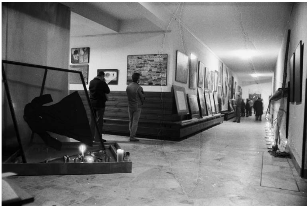
Wystawa „Przeciw złu, przeciw przemocy”, Kraków-Mistrzejowice 1985 r.