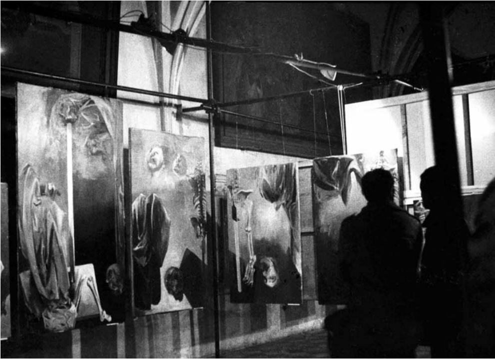
Wystawa „W stronę osoby”, klasztor oo. Dominikanów, Kraków 1985 r.